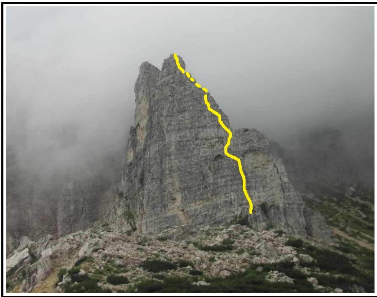
La guglia GEI con il tracciato della “Via Diretta”